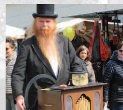
Grafica e foto: c. Stem, Agno / Stampa: Stampa Print SA, Agno